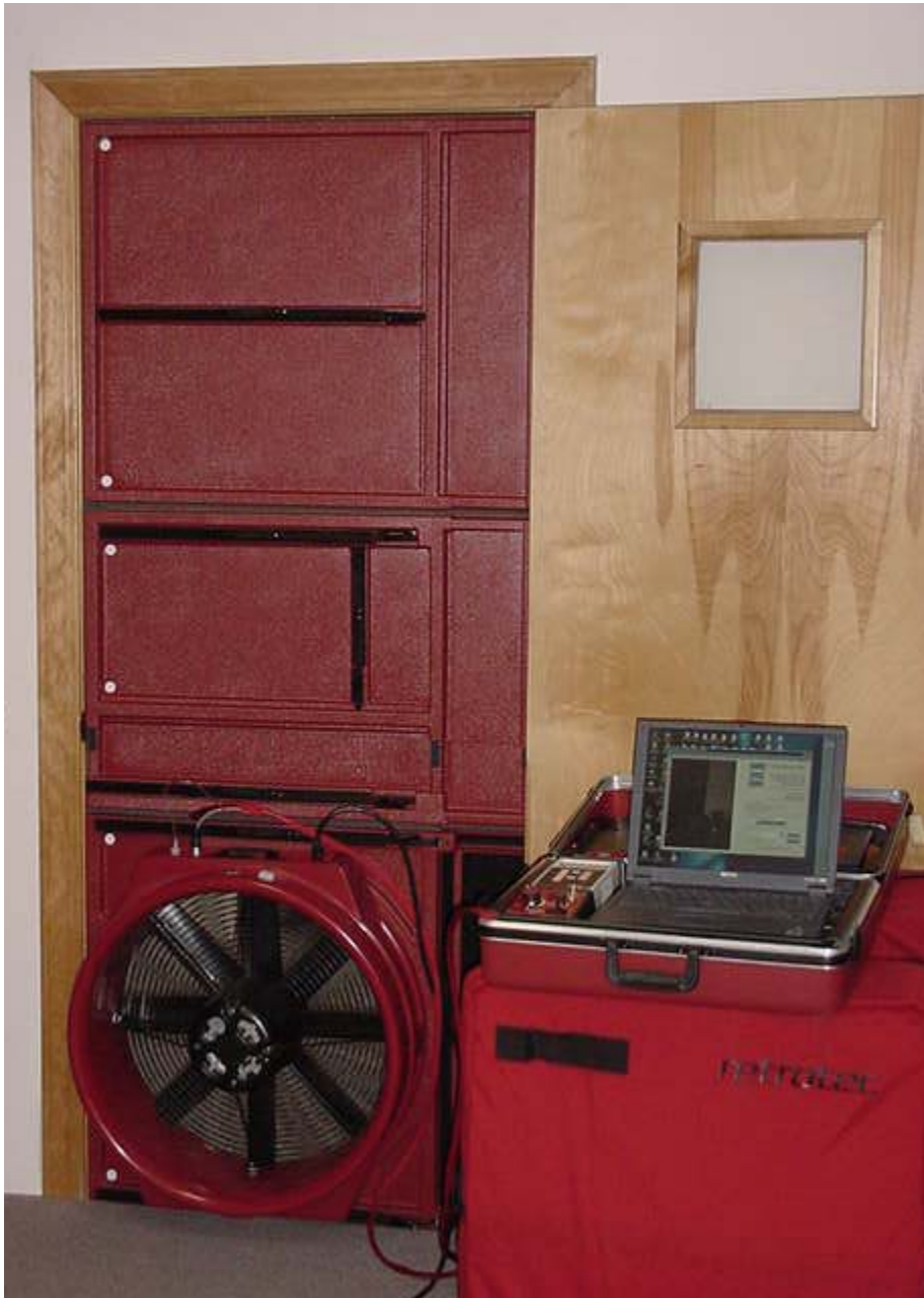
Model M53 set up in door way ready to test.