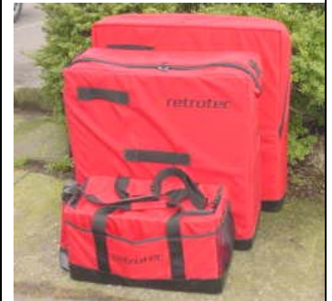
キャリングケース付き