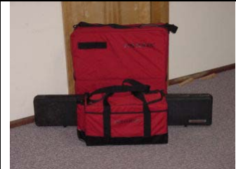
キャリングケース付き