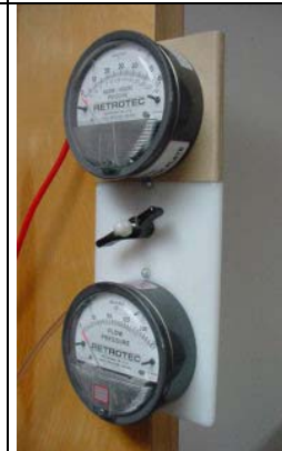
アナログゲージ(圧力計)